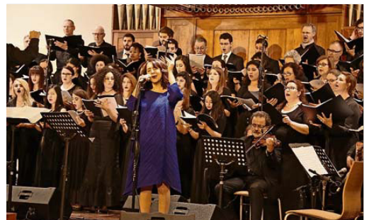
Der Chor während seines Auftritts in Beirut April 2017.

Der Brennpunkt Nahost rückt so abermals ins Rampenlicht, aber diesmal als kulturelle Hochburg. Das Pro-