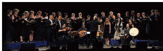
Orientalische Gesangskunst und europäischer Chorklang: Gemeinsam entsteht ein interkulturelles Chorprojekt.

Die Konzerte finden am Dienstag, 22. August, um 20 Uhr in der Martinskirche Chur und am Mittwoch, 23. August, um 20 Uhr in der Predigerkirche Zürich statt. Weitere Infos unter www.chorinterkultur.com